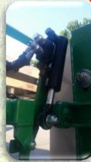
Inclinazione idraulica barra verticale SX