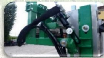
Sollevamento barra verticale SX idraulico