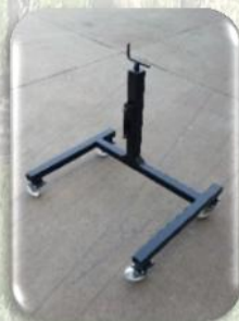
Cavalletto di sostegno regolabile in altezza