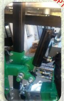
Inclinazione idraulica barra verticale DX