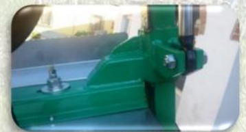
Regolazione altezza topping idraulico