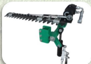
Barra Topping Inclinazione Idraulica