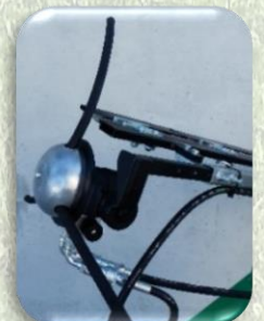
Convogliatore di tralci con regolatore di giri