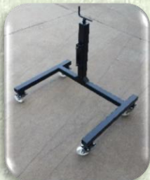
Cavalletto di sostegno regolabile

Cimatrice MOD. CTS 200 adatta per la cimatura del tendone veronese. Telaio ribassato e inclinazione della barra verticale di 115° fornita di una barra falciante monolama lunghezza 180 Cm. e di un convogliatore di tralci regolabile.