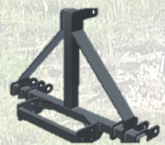
Attacco sollevatore 3