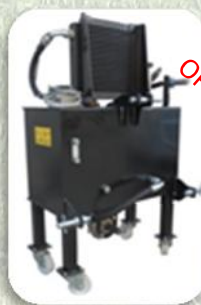
Impianto Idraulico 50 LT Portata 40 LT/MIN