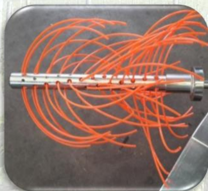
Rullo a fili per diserbo meccanico