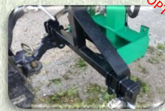
Attacco per sollevatore a 3 punti