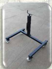
Cavalletto di sostegno regolabile in altezza