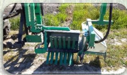
Testa spollonatrice con fustelle