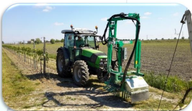
Spollonatrice SPS-650 in posizione di trasporto