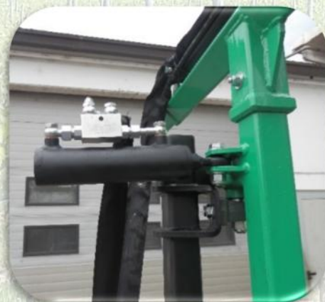
Cilindro per il rientro del braccio scavallante