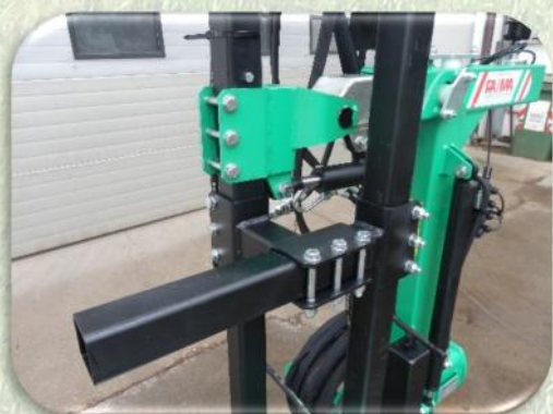
Regolazione profondità della testata spollonatrice interna